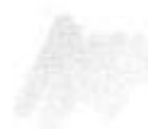
Wit (5D) Ral 9010