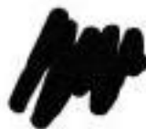
Anthraciet (5C) Ral 7016