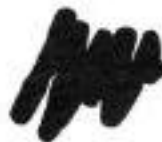
Alugrijs (5B) Ral 9006